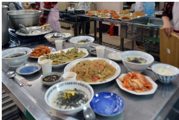
↑ 昼食メニュー 떡국(韓国式雑煮)、春雨炒めなど